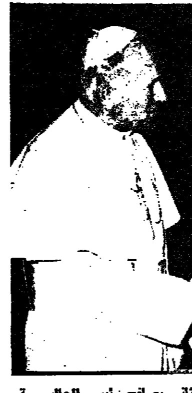
قداسة البابا يوحنا بولس الثاني يصافح رئيس الجالية اليهودية في المانيا الغربية مير لانجان...